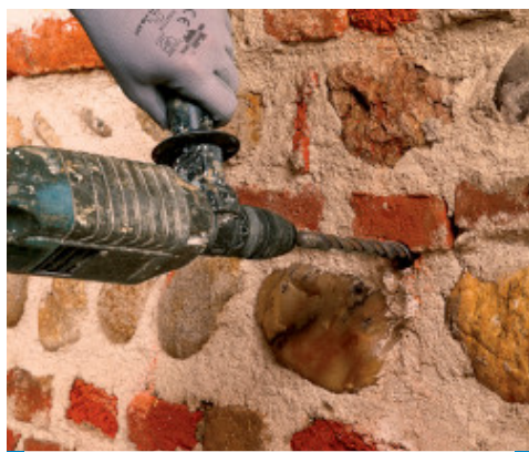
Realizzazione dei fori per Mapenet EM Connector

In presenza, inoltre, di una muratura "faccia a vista", rimuovere l'eventuale prodotto in eccesso ed effettuare la pulitura del paramento murario con acqua e frattazzo di spugna.