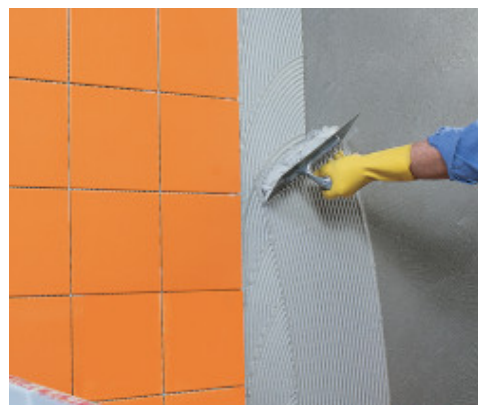
Incollaggio di rivestimento ceramico su MapeWall Intonaca & Rinforza