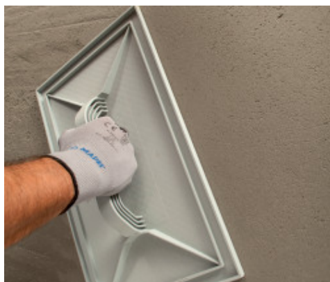
Ripianatura della superficie