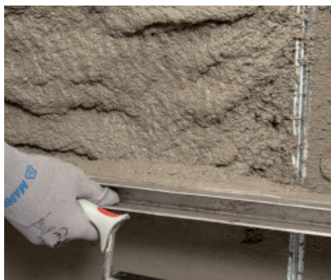
Staggiatura di MapeWall Intonaca & Rinforza